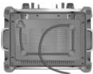
Modèle 5KTT890 Grille-pain 4 tranches