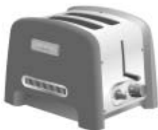
Modèle 5KTT780 Grille-pain 2 tranches