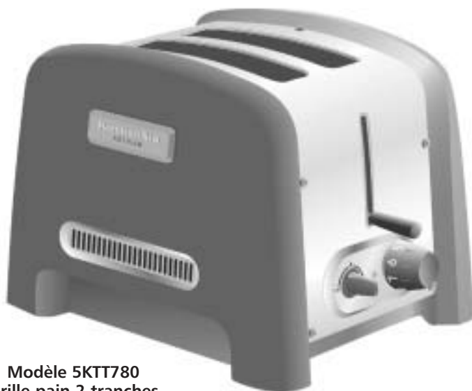
Modèle 5KTT780 Grille-pain 2 tranches