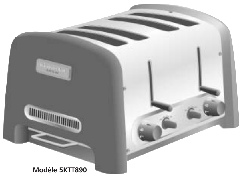
Modèle 5KTT890 Grille-pain 4 tranches