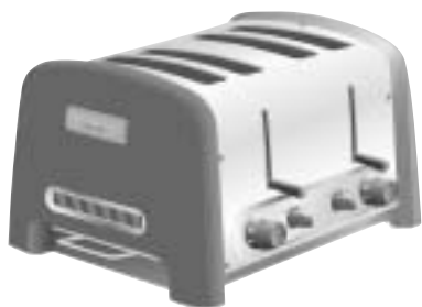
Modèle 5KTT890 Grille-pain 4 tranches

ΦΡΥΓΑΝΙΕΡΕΣ ARTISAN™ Οδηγίες χρήσης για τέλεια αποτελέσματα