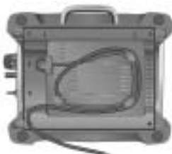
Modèle 5KTT780 Grille-pain 2 tranches